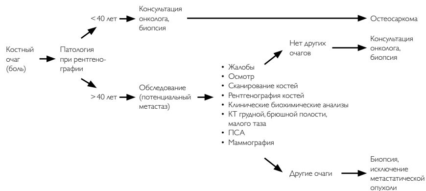
Рисунок 1. Рекомендуемый алгоритм диагностических мероприятий при остеосаркоме

Рекомендуемый алгоритм лечебно-диагностических мероприятий при остеогенной саркоме представлен на рис. 1 и 2.